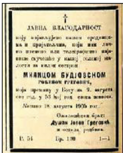
Sl. 3. „Јавна благодарност“, Глас Црногорца, XXXIV/33 (20. 8. 1905)