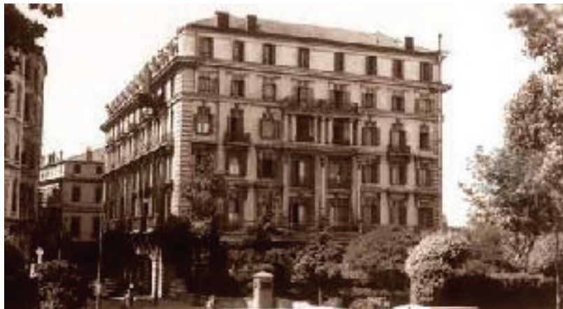
Sl. 7. Hotel Pera Palace, dvadesete godine XX vijeka ( https://famoushotels.org/hotels/pera-palace-hotel )