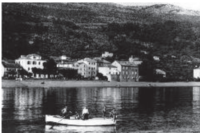
Sl. 1. Kuća porodice Gregović (druga slijeva), sredina XX vijeka