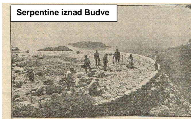
Serpentine iznad Budve

U tunelu je izvršeno 617 m 3 iskopavanja, a u galeriji 974 m 3 . Izgrađeno je u temeljima 368 m 3 zidova od maltera, a van temelja 1.131 m 3 . Postavljeno je u temelje 103 m 3 betona, a van temelja 278 m 3 , armiranog betona 127m 3 i 6.124 kg betonskog gvožđa. Takođe je postavljeno 162 m 3 drvene građe za mostove, dok je nabavljeno 3 m 3 građe za šipove, a šipova je pobijeno u dužini od 38 metara. Ozidano je dotjeranim kamenom 50 m 3 , postavljeno je 198 m kamene ograde i nabavljeno je 1.217 m 3 konstruktivnog kamena. Ukupni radovi koštali su zajedno sa Obl. samoupravom Zetske oblasti i